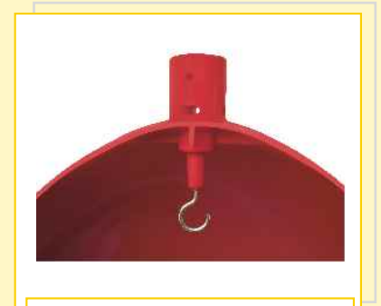
Detalhe da suspensão do contrapeso para matrizes